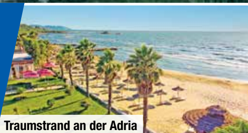
Traumstrand an der Adria

Großes Erlebnisprogramm mit Tirana, Durrës, Vlora, antikem Apollonia und Weinverkostung