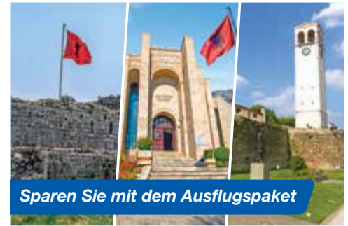
Sparen Sie mit dem Ausflugspaket

Einreisebestimmungen: Für diese Reise benötigen Deutsche, Schweizer sowie alle EU-Staatsbürger einen bei Reiseende noch mindestens 3 Monate gültigen Reisepass. Deutsche können auch mit einem bei Reiseende noch mindestens 3 Monate gültigen Personalausweis reisen, kein vorläufiger Personalausweis. (Stand: Dezember 2024)