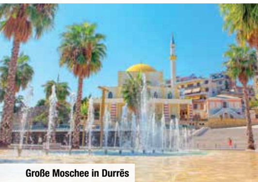
Große Moschee in Durrës