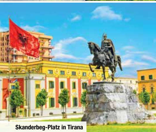
Skanderbeg-Platz in Tirana